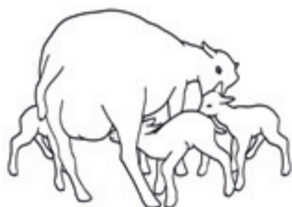
Trillingar eller fler