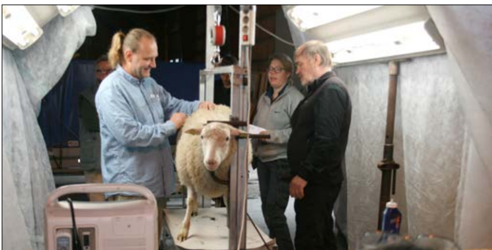
Riksbedömning av finullsbagge

Totalt under år 2016 deltog 565 stycken bagglamm i av SF arrangerad riksbedömning, av dessa var 505 stycken Gotlandsfår, 45 st Leicester och 15 stycken Finull. Det innebar en minskning med 80 st bagglamm jämfört mot föregående år.