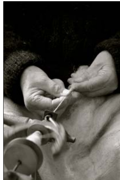
Ull- En värdefull resurs