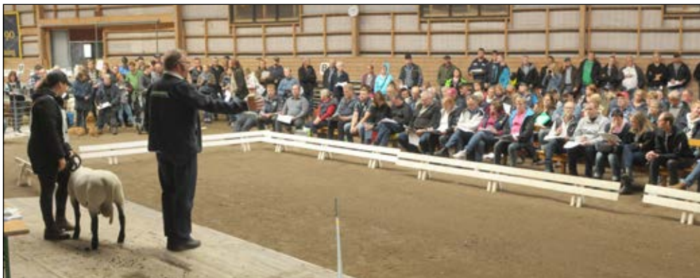
Livdjursauktionen i Linköping lockar besökare och spekulanter!

Året 2016 har SF deltagit med monter vid Fårfesten i Kil i mars samt ELMIA i Jönköping i oktober, och representerat vid de baggauctioner som arrangerats i Linköping, Jönköping, Gotland och Mälardalen.