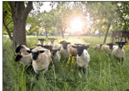
Fårnäringen stiger fram!

Arbetet genomförs i arbetsgrupper inom område marknad, export, produktion, stöd & regler, samt för fårnäringen även arbetsgruppen för ull- och skinn. Syftet med handlingsplanerna